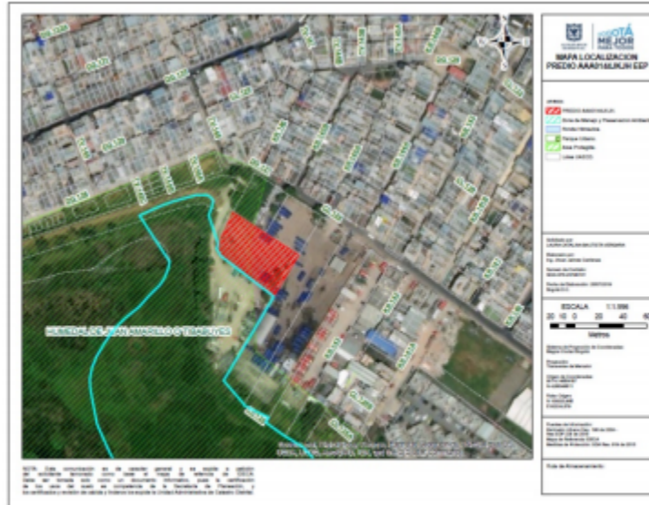
Imagen 01. Plano de ubicación del predio

El predio identificado con chip catastral AAA0144JZTD se encuentra totalmente dentro del área protegida Parque Ecológico Distrital de Humedal Juan Amarillo, como se establece en el Decreto Distrital 190 de 2004. Adicional a ello, se encuentra parcialmente en corredor ecológico de ronda como se evidencia a continuación: